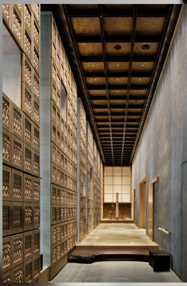
左上:星のや東京 左下:シーパルピア女川 右下:亀甲新